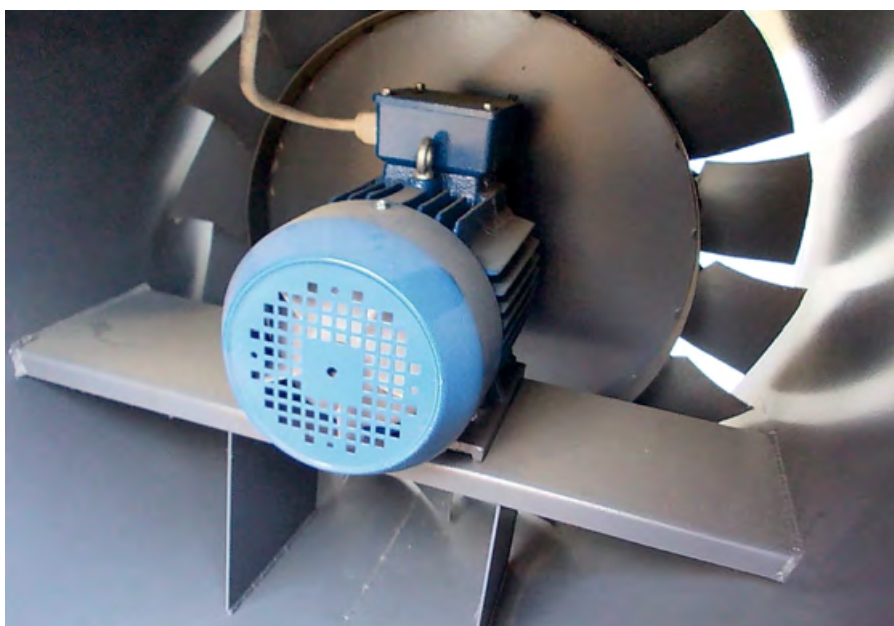
❖ Фото 4. Серийный «нонейм», выдаваемый по документам за технику «ВЕЗА». Непрочный прерывистый шов на корпусе. Китайский электродвигатель. Большие зазоры на колесе. Неаэродинамическая стойка мотора

Минимизируя торговые наценки, честные изготовители поставляют оборудование напрямую. Цепочка посредников заменена на официальных дилеров или собственные сбытовые офисы.