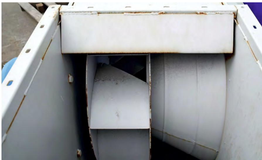
❖ Фото 2. Значительно упрощён аэродинамический вход потока в колесо. Колесо с плоским передним диском. Плохая окраска — корпус ржавеет через месяц хранения на улице