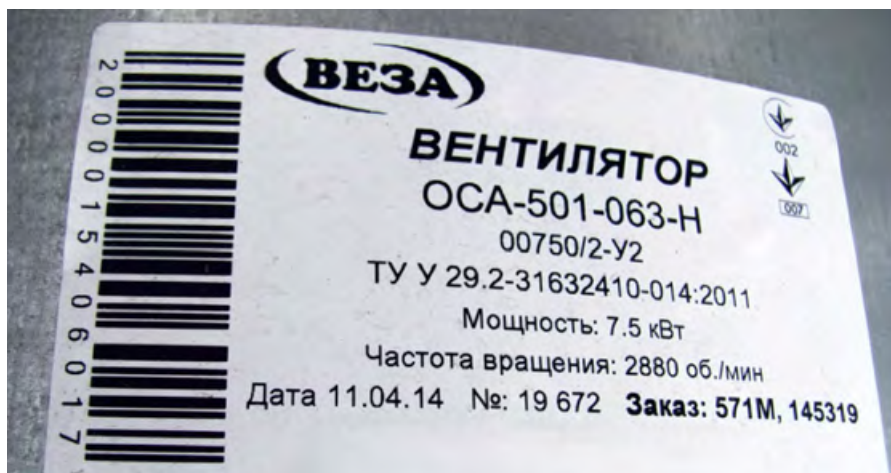
❖ Фото 6. Все заводы «ВЕЗА», включая производство в Гомеле, Брянске, Миассе и Харькове, имеют единую систему учёта маркировок готовой продукции для сканирования по штрих-кодам. Все изделия произведены строго под заказ. №145319 — шестизначный номер счета «ВЕЗА» — можно проверить по базе данных «1С» простым телефонным звонком