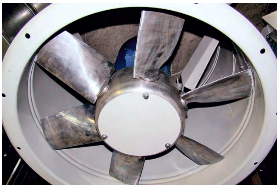
❖ Фото 7. Оригинал «ВЕЗА» — идеально отформованный фланец корпуса, минимальные зазоры не более 0,5% от диаметра колеса (5,0 мм для осевого вентилятора №10), наборное колесо из литьевых лопаток аэродинамического профиля. Продольный шов корпуса невидим после роботизированной сварки

С 2014 года «ВЕЗА» целенаправленно «вычисляет» объекты, на которые было поставлено контрафактное оборудование, и заводит судебные иски на конечных приобретателей. Использование фирм-однодневок при перепродаже фальсифицированной продукции не означает отсутствие ответчика.